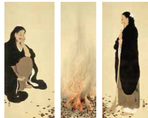
《焚火》横山大观 1915年 YOKOYAMA Taikan : Hanshan and Shide by a Bonfire

本馆收藏的油彩和日本画当中多数是与熊本有关联的画家们的代表作。从“版画收藏珍品”中，我们可以得知我国现代版画艺术已经发展成为丰富多彩的艺术群体。