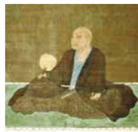
细川藤孝（幽斋） HOSOKAWA Fujitaka (yusai)