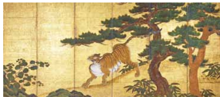
《松虎、竹虎图》双画中的右画 传为是矢野三郎兵卫画 江户时代初期 Attributed to YANO Saburobe : Tigers with pine trees and Bamboos Right screen Early Edo period

这里所收藏的传统美术作品当中的大多数是带有强烈武士文化色彩的。书画作品当中的大部分是当时熊本藩特聘的矢野流派与狩野流派画家的绘画、藩主与学者书写的唐代风格书法及文人、僧侣的作品。陶瓷器则收藏了八代陶瓷、小代陶瓷及网田陶瓷等熊本传统瓷窑的作品。作为近代工艺作品收集了熊本出身的国宝级大师的漆器等精湛作品。