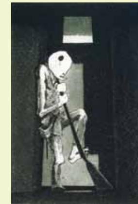
滨田知明《初年兵哀歌 (步哨)》1954年 HAMADA Chimei : Elegy for a new Conscript : Sentinel

这是居住在熊本の国际著名版画家、雕刻家滨田知明先生作品的展览室，在这里依次更换展出10幅作品。