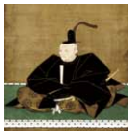
细川忠利 HOSOKAWA Tadatoshi

在这里可欣赏寄存于熊本县立美术馆的近代屏风及近代日本画，同时还可欣赏来自东京“永青文库”的艺术工艺品。