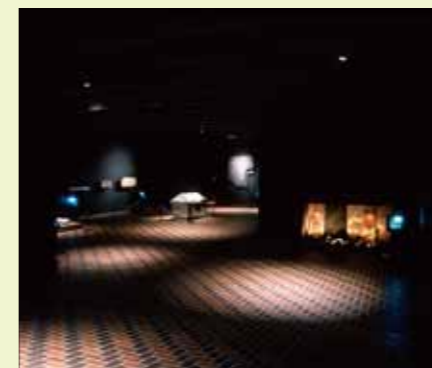
装饰古坟室 Decorated Ancient Burial Mound Exhibition Room

装饰古坟是指在石棺、石室及横穴式古坟内外的墙壁上，绘有及刻有彩色绘画的古坟。装饰古坟建于5世纪至7世纪，全国现已挖掘出的装饰古坟共有660座（截止2010年），其中大多数分布于九州北部与中部。特别是在熊本县内就集中了196座，因而引起了考古界的注目。本馆的“装饰古坟室”中展示着具有熊本县代表性的装饰古坟的实物及复制品。