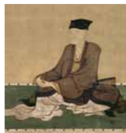
细川忠兴（三斋） HOSOKAWA Tadaaki (sansai)