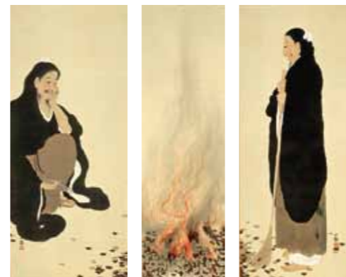
《焚火》横山大观 1915年 YOKOYAMA Taikan : Hanshan and Shide by a Bonfire

本馆收藏的油彩和日本画当中多数是与熊本有关联的画家们的代表作。从“版画收藏珍品”中，我们可以得知我国现代版画艺术已经发展成为丰富多彩的艺术群体。