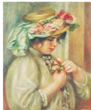
《胸前戴花的姑娘》雷诺阿 1900年左右 RENOIR : Jeune Fille Fleurissant Son Copsage