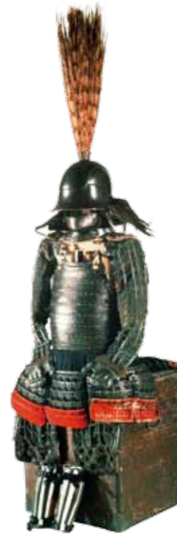
黒糸威横刃二枚胴具足 (細川忠興所用) 桃山時代 永青文庫蔵 Gusoku Armor of Nimaido Tite, Laced with Black Threads Worn by HOSOKAWA Tadaoki Momoyama period Collection of Eisei-Bunko

※ 永青文庫コレクションより（常時展示しているものではないです） These works are part of the Eisei-Bunko collection and are not always exhibited.