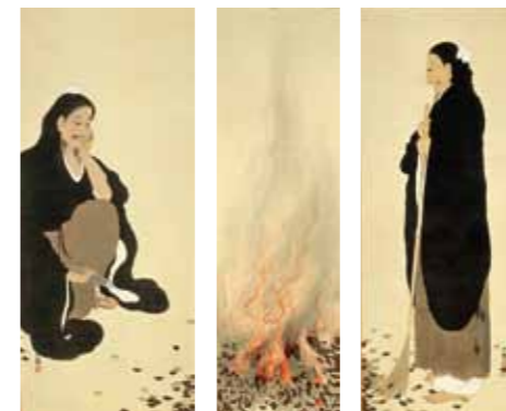
横山大観《焚火》1915年 YOKOYAMA Taikan : Hanshan and Shide by a Bonfire

This collection houses the most important works of eminent pictorial artists with ties to Kumamoto and shows a variety of developments in Japanese contemporary prints.