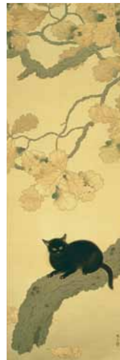
黒き猫 菱田春草筆 絹本着色 1910年 永青文庫蔵 熊本県立美術館寄託 重要文化財