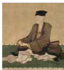
細川忠興 (三斎) HOSOKAWA Tadaoki (sansai)