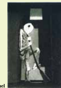
浜田知明《初年兵哀歌（歩哨）》1954年 HAMADA Chimei : Elegy for a new Conscript : Sentinel

HAMADA Chimei is a globally-known printmaker and sculptor living in Kumamoto. The museum exhibits his prints and sculptures on a rotation basis.