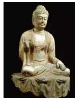
如来坐像 中国・唐時代 永青文庫蔵 重要文化財