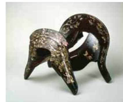
時雨蝶細鞍 鎌倉時代 永青文庫蔵 国宝 Saddle with Ivy and Poem Characters Design Lacquer with inlaid Mother-of-Pearl Kamakura period Collection of Eisei-Bunko National Treasure