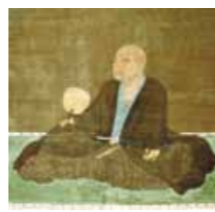
細川藤孝 (幽齋) HOSOKAWA Fujitaka (yusai)