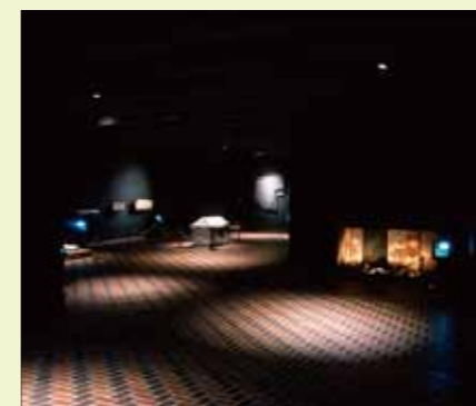
装飾古墳室 Decorated Ancient Burial Mound Exhibition Room

装飾古墳とは、石棺や石室あるいは横穴墓の内・外面に、彫刻や彩色により文様や絵画などの装飾を施した古墳のことです。5世紀から7世紀頃まで造られ、全国で660基（平成22年現在）が知られていますが、九州の北・中部に集中的に存在しています。とくに熊本県内には196基が分布しており、装飾古墳の発生と展開などを考えるうえで注目されています。本館の装飾古墳室は、熊本県の代表的な装飾古墳を実物とレプリカで再現したものです。