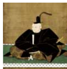
細川忠利 HOSOKAWA Tadatoshi

熊本県立美術館に寄託されている近世の屏風や近代日本画はもとより、東京の永青文庫の様々な美術工芸品を、熊本にいながらにして鑑賞できるスペースとなっています。