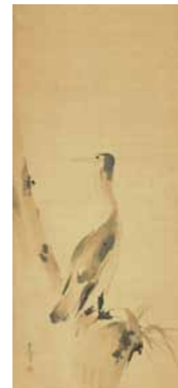
鸕鷀図 宮本武蔵筆 紙本墨画 江戸時代前期 永青文庫蔵 熊本県立美術館寄託 重要文化財