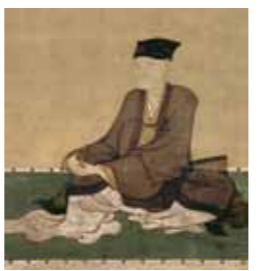
호소카와 타다오키 (細川忠興) (산사이: 三斎) HOSOKAWA Tadaoki (sansai)