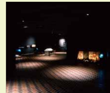
장식고분실 Decorated Ancient Burial Mound Exhibition Room

장식고분이란 석관(石棺)이나 석실(石室) 또는 횡혈묘(橫穴墓) 내면과 외면에 조각이나 채색으로 문양이나 회화 등을 장식한 고분입니다. 5세기부터 7세기 무렵에 만들어져 전국적으로 660기(2010년 현재)가 알려졌으며, 규슈 북부와 중부에 집중적으로 존재하고 있습니다. 특히 구마모토현 내에는 196기가 분포하고 있어, 장식고분의 발생과 전개 등을 생각하는 데 있어 주목을 받고 있습니다. 본관의 장식고분실은 구마모토현의 대표적인 장식고분을 실물과 복제품으로 재현한 것입니다.