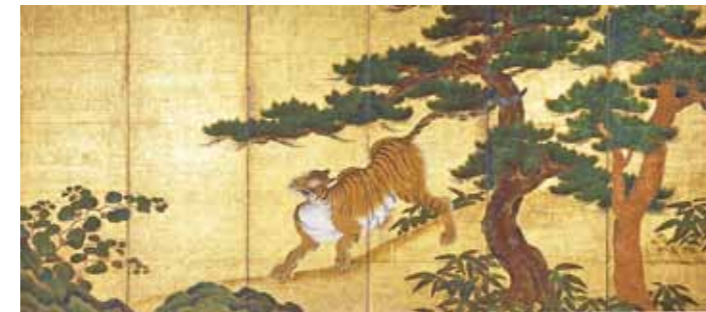
전 야노 사부로우베(矢野三郎兵衛) 《소나무와 호랑이·대나무와 호랑이 그림》 17세기 우측 병풍 Attributed to YANO Saburobe : Tigers with pine trees and Bamboos Right screen Early Edo period

구마모토와 연고가 깊은 고대 미술과 무가(武家) 문화의 색채가 짙은 것이 많고 구마모토 번(熊本藩) 어용 화가의 회화, 지방 영주나 학자에 의한 중국 양식 서적, 문인이나 승려에 의한 작품, 전통가마의 도자기 등이 중심입니다. 근대 공예에서는 옷나우 공예 등 구마모토 출신인 인간문화재 작가의 우수한 작품을 소장하고 있습니다.