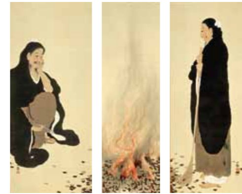
요코야마 타이칸(横山大観) 《모닥불: 焚火》 1915년 YOKOYAMA Taikan : Hanshan and Shide by a Bonfire

유채·일본화는 구마모토와 연고가 깊은 작가를 중심으로 대표적인 작품을 소장하고 있습니다. 판화 컬렉션은 일본 현대 판화의 다양한 전개가 보이는 작품들입니다.