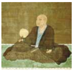
호소카와 후지타카 (細川藤孝) (유사이: 幽齋) HOSOKAWA Fujitaka (yusai)