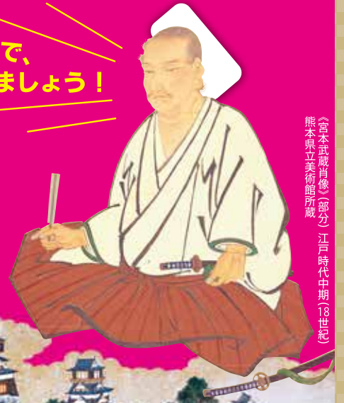
〔宮本武蔵肖像〕(部分) 江戸時代中期(18世紀) 熊本県立美術館所蔵