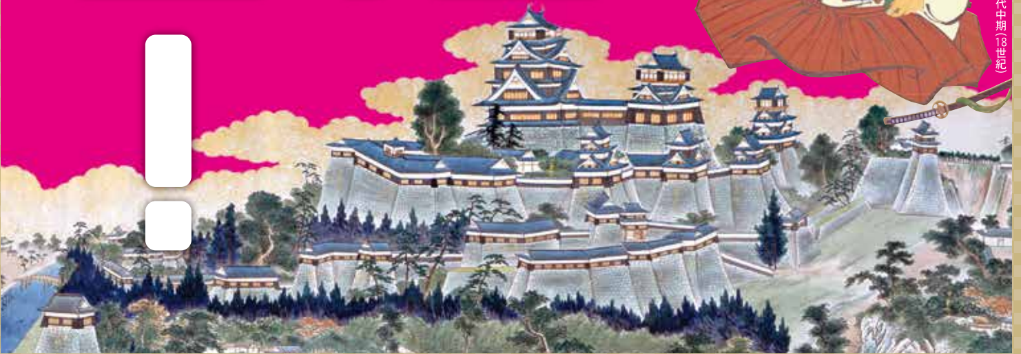
赤星閑意《熊本城東面図》(部分) 明治時代(19世紀) 永青文庫所蔵〔後期展示〕